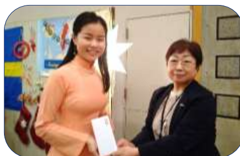
ロータリー米山記念奨学金贈呈